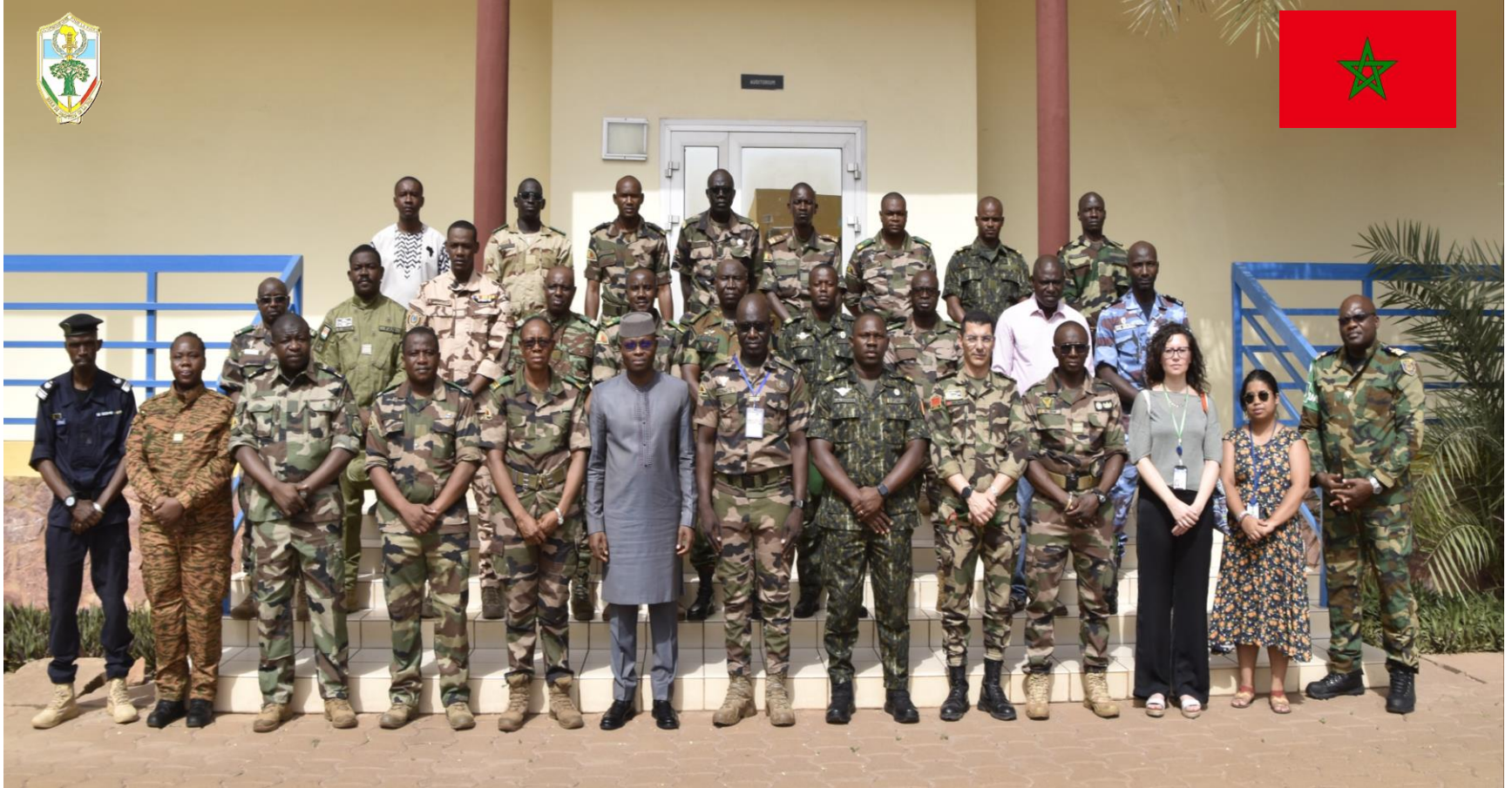
Formation des Officiers d'Etat Major des Nations-Unis– UNSOC 1-24 EMP-ABB