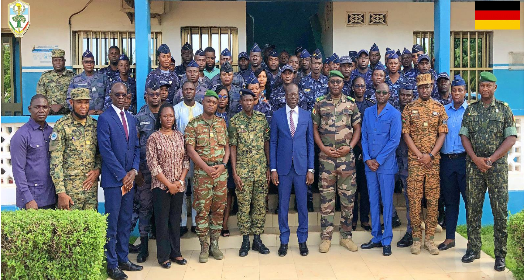
Logistique des Nations-Unies UNLOG 1-24 Lomé-TOGO Du 03 au 14 Juin 2024